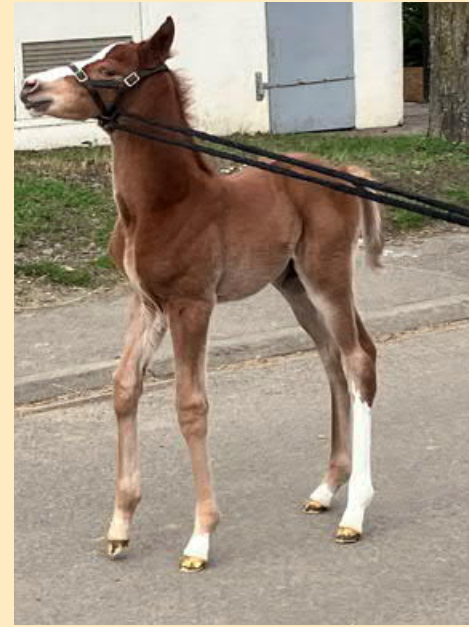
Deux poulains sont nés en 2023 à Kleinfrankenheim